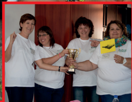
Semmelweis Napi kitüntetések