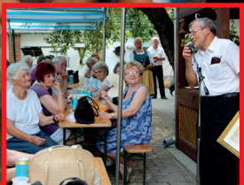
Sváb parti a Tájházban