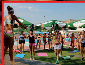
Forró fitnessz fieszta