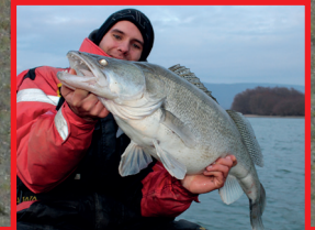
Pergethet a világbajnokságon