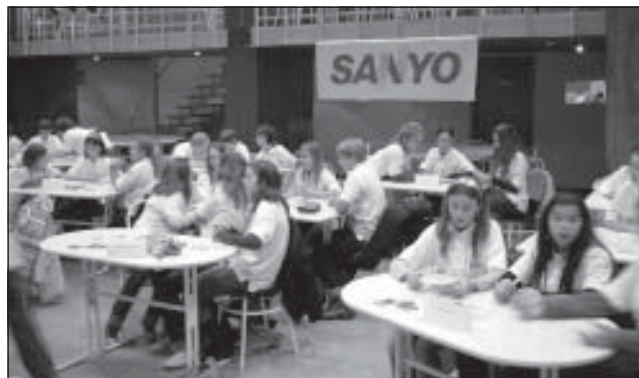
23 csapat részvételével környezetvédelmi vetélkedő zajlott január 29-én