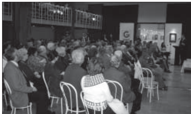
A Magyar Kultúra Napján rendezett városi ünnepségünket nagyon sok érdeklődő tisztelte meg