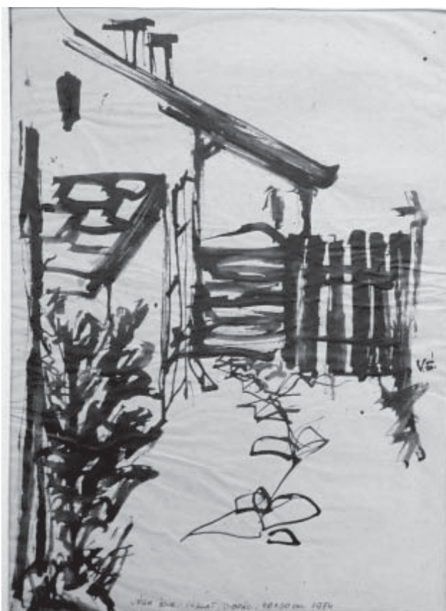
Végh Éva: Kertkapu