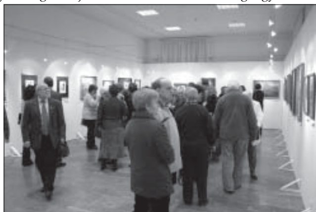
25 év képzőművészeti alkotásai a galériában

Így volt ez az óév búcsúztatását követően, az újévet köszöntöttük tűzijátékunkkal. A város minden polgárát köszöntötte a tűzijáték, különösen azokat, akik nagyon sokat tettek azért, hogy a nagyközség