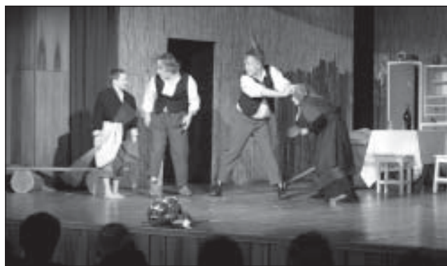
A színház bérlet 2. előadása az Indul a bakterház nagy sikert aratott február 6-án a színházteremben