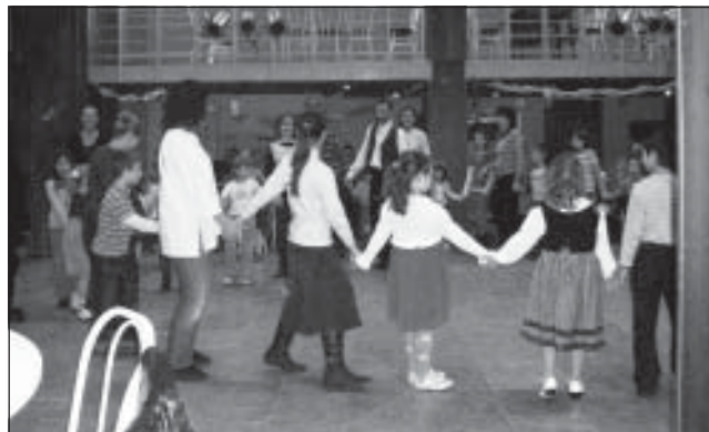
Felvidékről érkezett táncosok tartottak táncházat január 25-én a művelődési házban