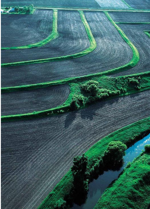
Szintvonalak mentén kialakított füves mezsgyék