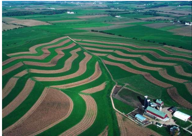
Szintvonalak mentén kialakított sávos (szalagos) művelés