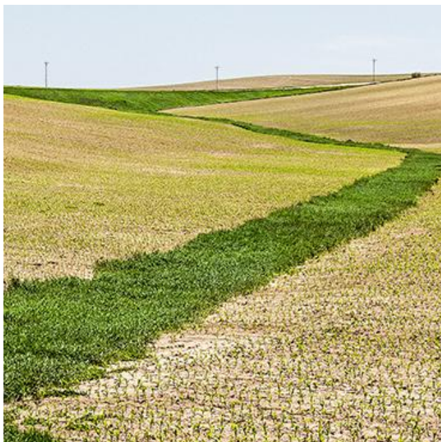
Átművelhető gyepesített vízvezető